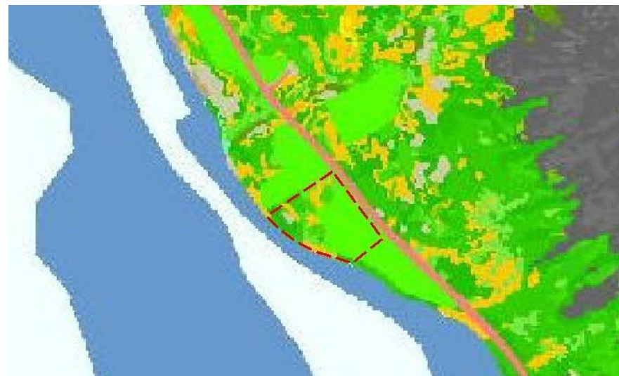
Mynd 3 Vistgerðir á skipulagssvæðinu. Skjáskot af Vistgerðarkorti NÍ. 9

Innan skipulagssvæðisins er ekkert náttúruyfyrirbæri sem fellur undir sérstaka vernd vistkerfa og jarðminja samkvæmt 61. grein laga um náttúruvernd nr. 60/2013. Neðan svæðisins eru leirur sem njóta verndar skv. ofangreindri grein laganna. 8