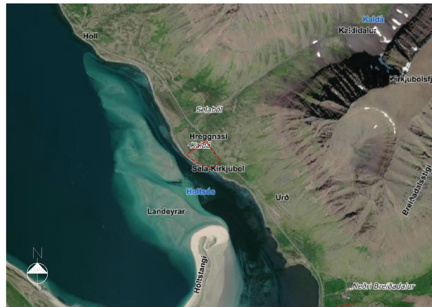
Mynd 1 Fyrirhugað skipulagssvæði, afmarkað með rauðri brotalínu. Skjáskot af vefsíðu LMÍ. 4

ekki við á skipulagssvæðinu nema að litlu leyti. Svæðið telst ekki mikilvægt fuglasvæði skv. Vistgerðarkorti Náttúrufræðistofnunar Íslands 3 .